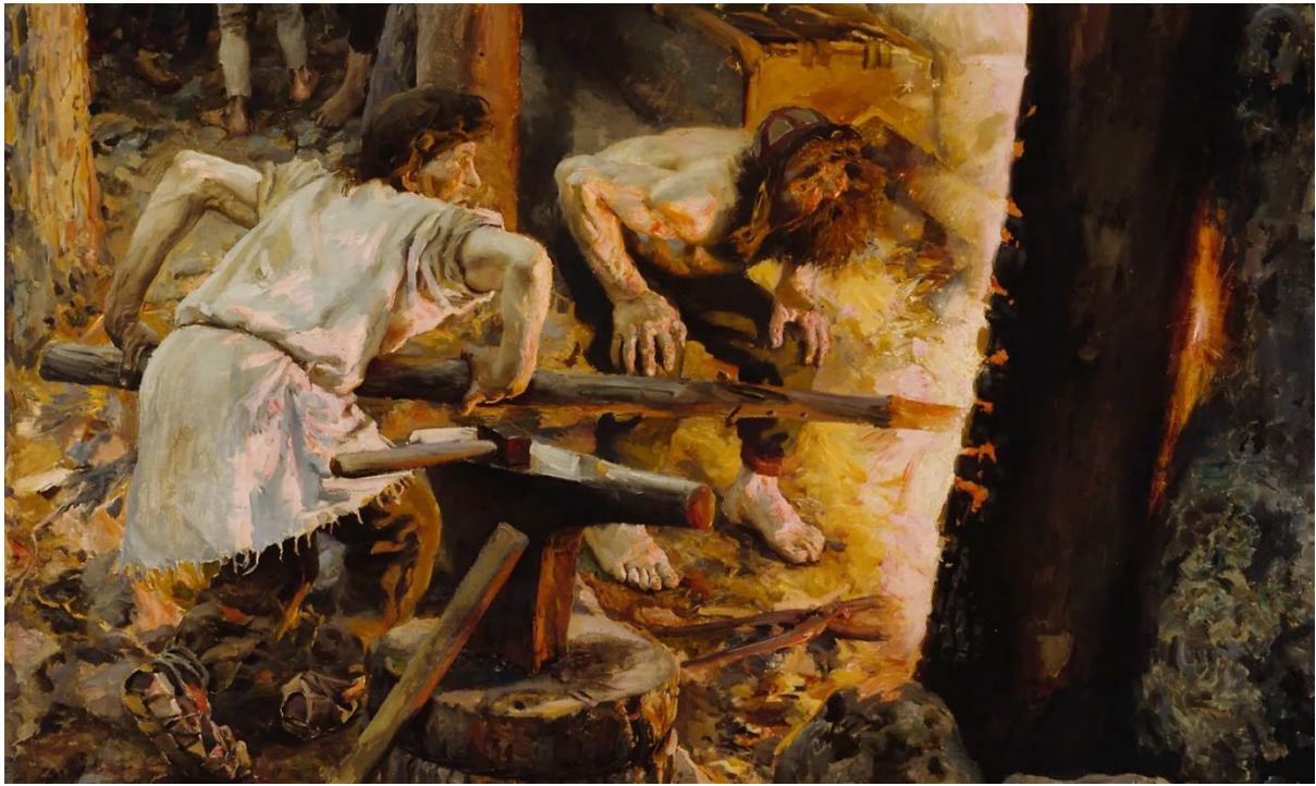
Akseli Gallen-Kallela: Sammon taonta (yksityiskohta), 1893, Ateneumin taidemuseo (tekijänoikeusvapaa)